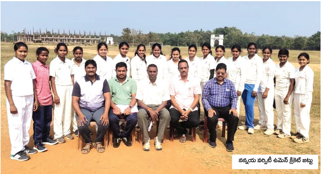
నన్నయ వర్సిటీ ఉమెన్ క్రికెట్ జట్టు