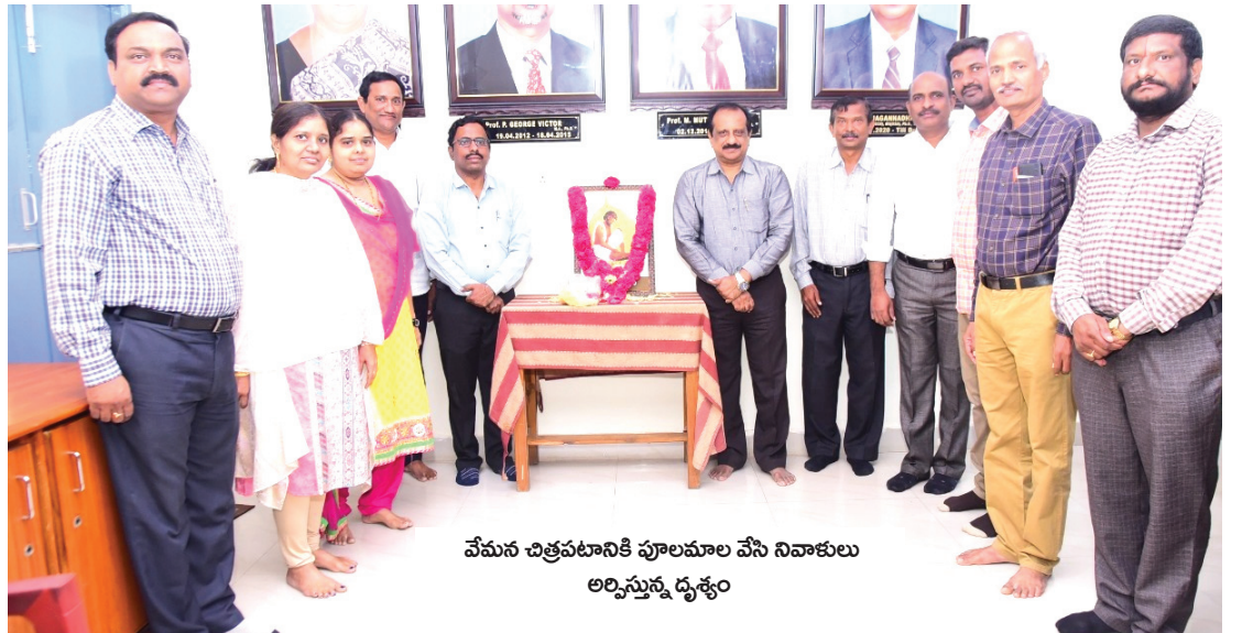
వేమన చిత్రపటానికి పూలమాల వేసి నివాళులు అర్పిస్తున్న దృశ్యం